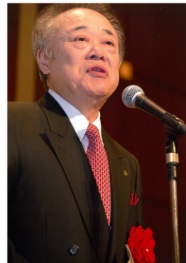
全国理容生活衛生同業組合連合会