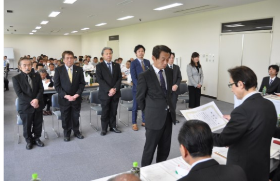
(写真)県組合退職役員表彰