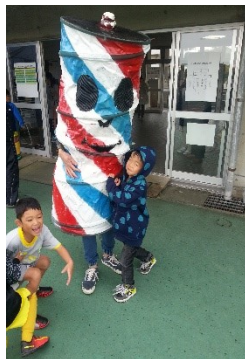
手作りのチョコキちゃんも13歳で～す！