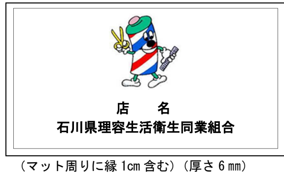
②番 ロゴ+店名+組合文字